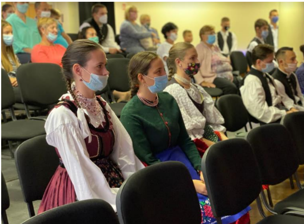
Várákosva - Szarvas