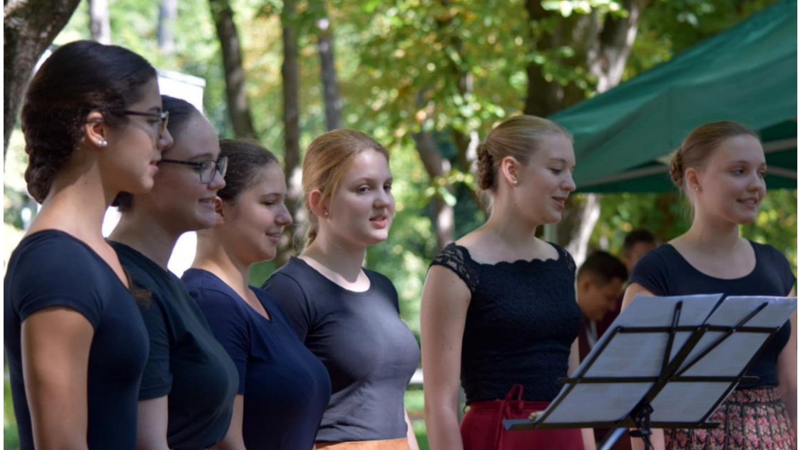
2020. augusztus 22. Kárpát-medencei Népzenei Találkozó