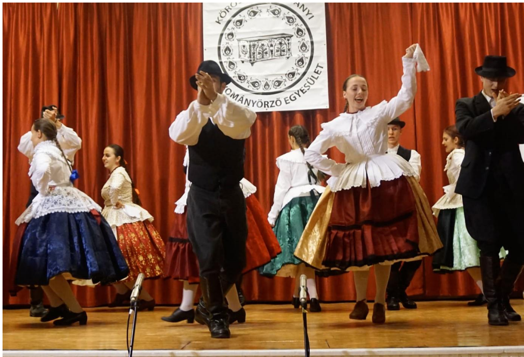
Színpadi műsor – Körösnagyharsány