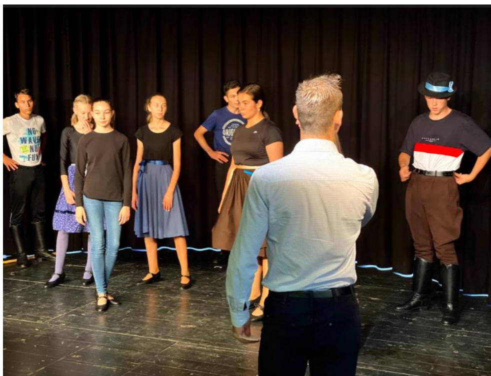
Színpadbejárás - Szarvas

2020. augusztus 21-szeptember 26. Minitalálkozók (Gyomaendrőd, Körösnagyharsány, Gyula, Újkígyós, Szarvas)